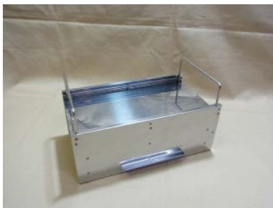
10. 脚用パーツ装着完了。