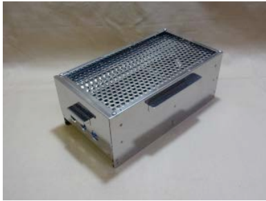
1. 収納形体。コンパクトな箱の状態です。 (固形燃料の収納もできます。)