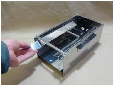
4. ヤキトリ五徳(2本)を引き出します。