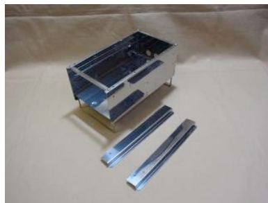
11. ヤキトリ五徳を用意します。