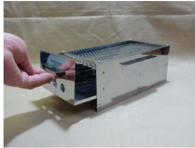
2. トレーは少し持ち上げるようにして引き出します。