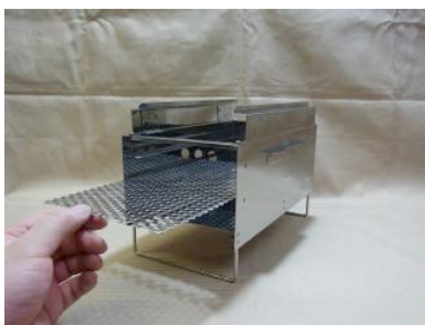
13. パンチング板はストーブ内壁下部の火床受けにのせます。(固形燃料不使用)