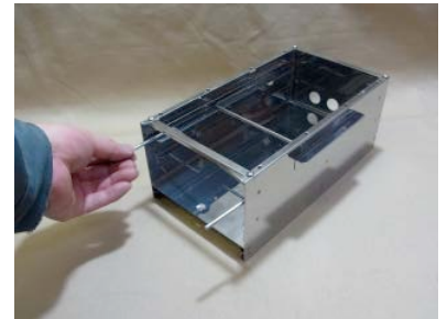
6. 脚用パーツを引き出します。