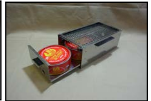
収納時は箱の状態(固形燃料2個収納可能)