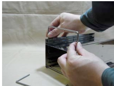
8. 脚用パーツをストーブ本体底側の穴に差し込んでください。