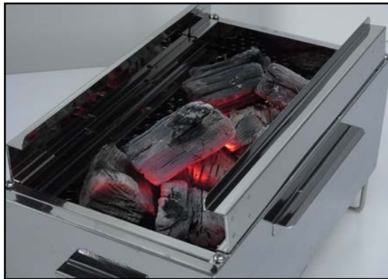
(木炭、木炭 燃焼使用例)