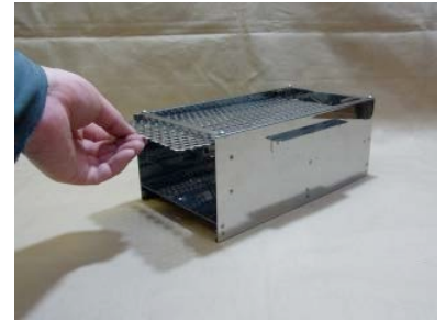
3. まずはフタにしてあるパンチング板を引き出す。