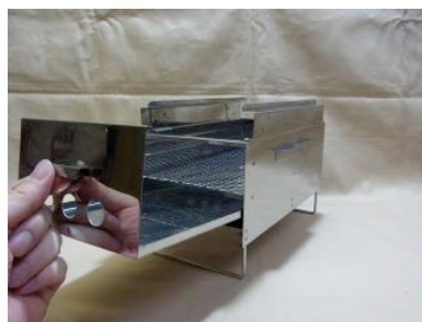
14. トレーを差込みます。