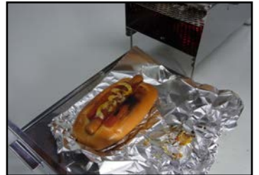
トレーを使った調理例