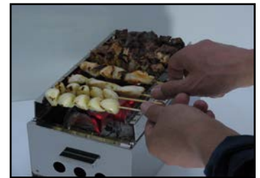
ヤキトリ五徳を装着してヤキトリも焼けます。