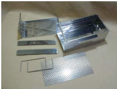
7. パーツ確認。 本体、トレー、パンチング板、脚用パーツ2本 ヤキトリ五徳2本。