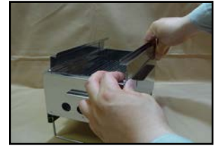
(ヤキトリ五徳取り付け)