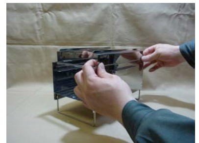
12. ヤキトリ五徳は本体上部のフチに差し込みます。